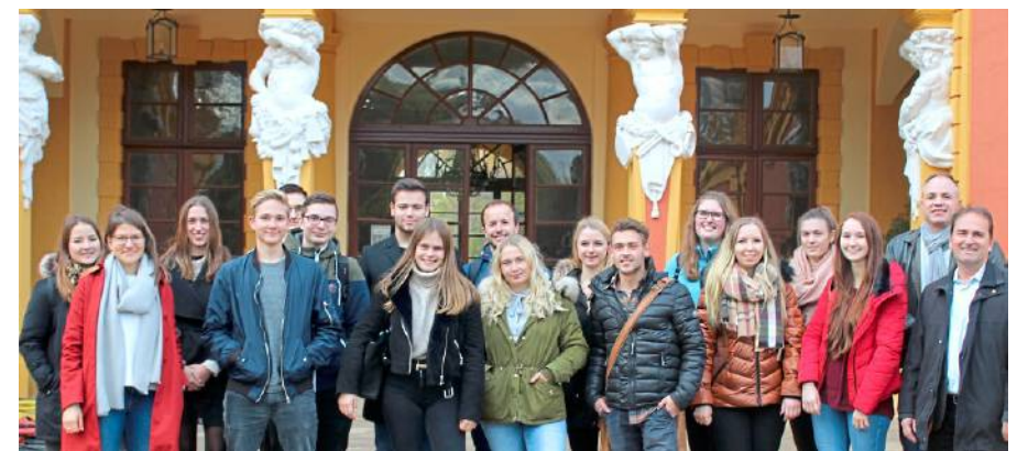
Die Projektteilnehmer (vor der Coronakrise) vor dem Schloss Favorite.

Der Integrationsrat setzt sich aus sachkundigen Einwohnern zusammen und berät die Verwaltung und die Kommunalpolitik in integrationsrelevanten Themen wie Bildung, Gesundheit, Integrationsarbeit, Interkulturelle Öffnung, Schaffung neuer Angebote, Senioren, Wirtschaft und Arbeitsmarkt und Wohnen. (red)