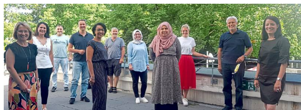
Die Teilnehmer der Schulung zum Thema Kommunalpolitik.

Die Befragung zeigt das große Potenzial der Schlösser. Im Zuge der Partnerschaft der Hochschulen mit der Schlossverwaltung gibt es Überlegungen, zum Studienbeginn Führungen für Studenten anzubieten. (red)